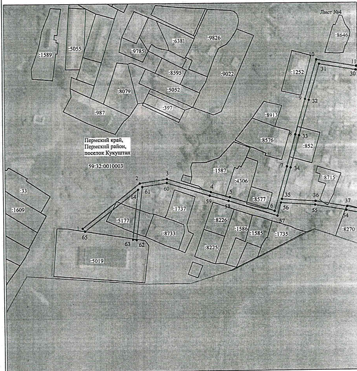
Схема расположения границ публичного сервитута объекта